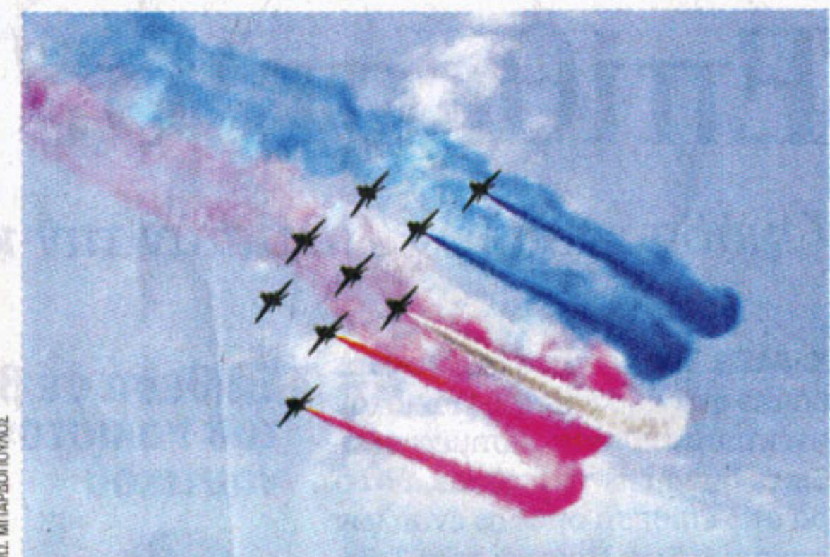
Φαντασμαγορικό θέαμα από τα Red Arrows, που ήρθαν στη Ελλάδα για τρίτη συνεχής χρονιά.