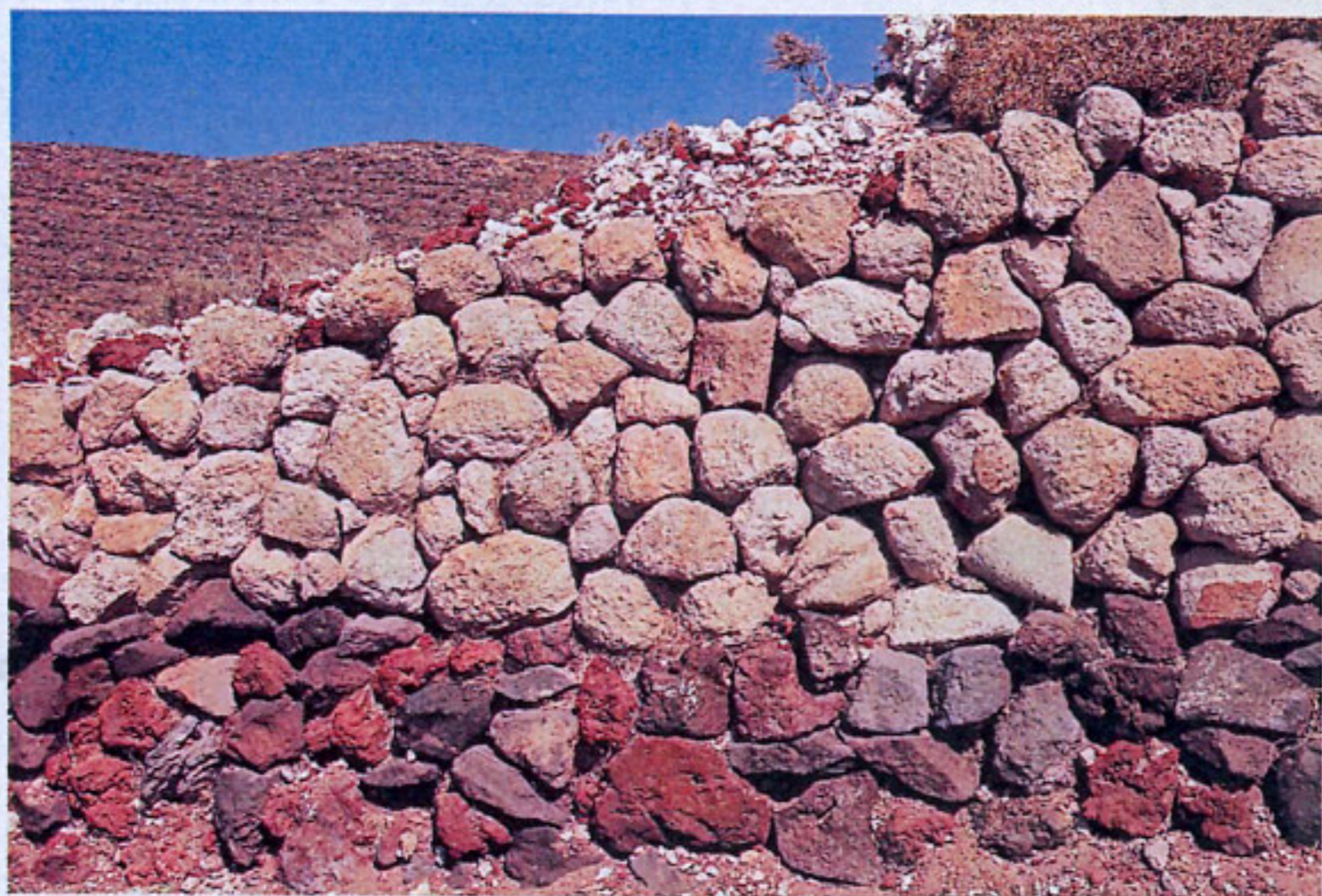
Πρώτα τα κομμάτια της σκουρόχρωμης λάβας και μετά τα κομμάτια της ανοιχτόχρωμης κίσηρης... Μια σύνθεση σε μανδρότοιχο στα Νικιά που ακολουθεί τους κανόνες του ηφαιστειού και των εκρήξεών του. Πρώτα εκχύνονται οι λάβες και στη συνέχεια έρχεται η κίσηρη... μια διαδικασία που επαναλήφθηκε τουλάχιστον τέσσερις φορές φτιάχνοντας έτσι το ηφαιστειακό οικοδόμημα της Νισύρου