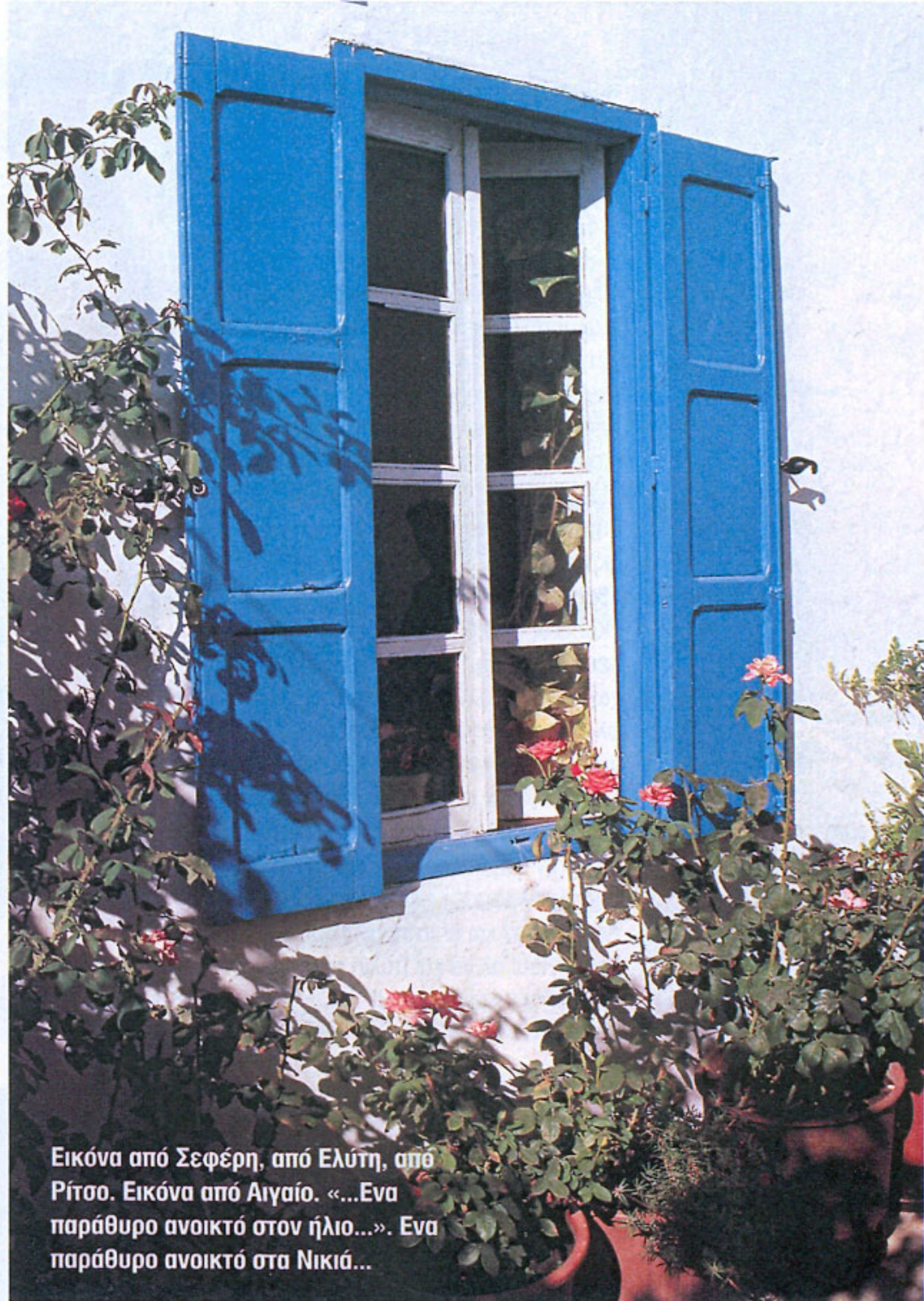
Εικόνα από Σεφέρη, από Ελύτη, από Ρίτσο. Εικόνα από Αιγαίο. «...Ένα παράθυρο ανοικτό στον ήλιο...». Ένα παράθυρο ανοικτό στα Νικιά...