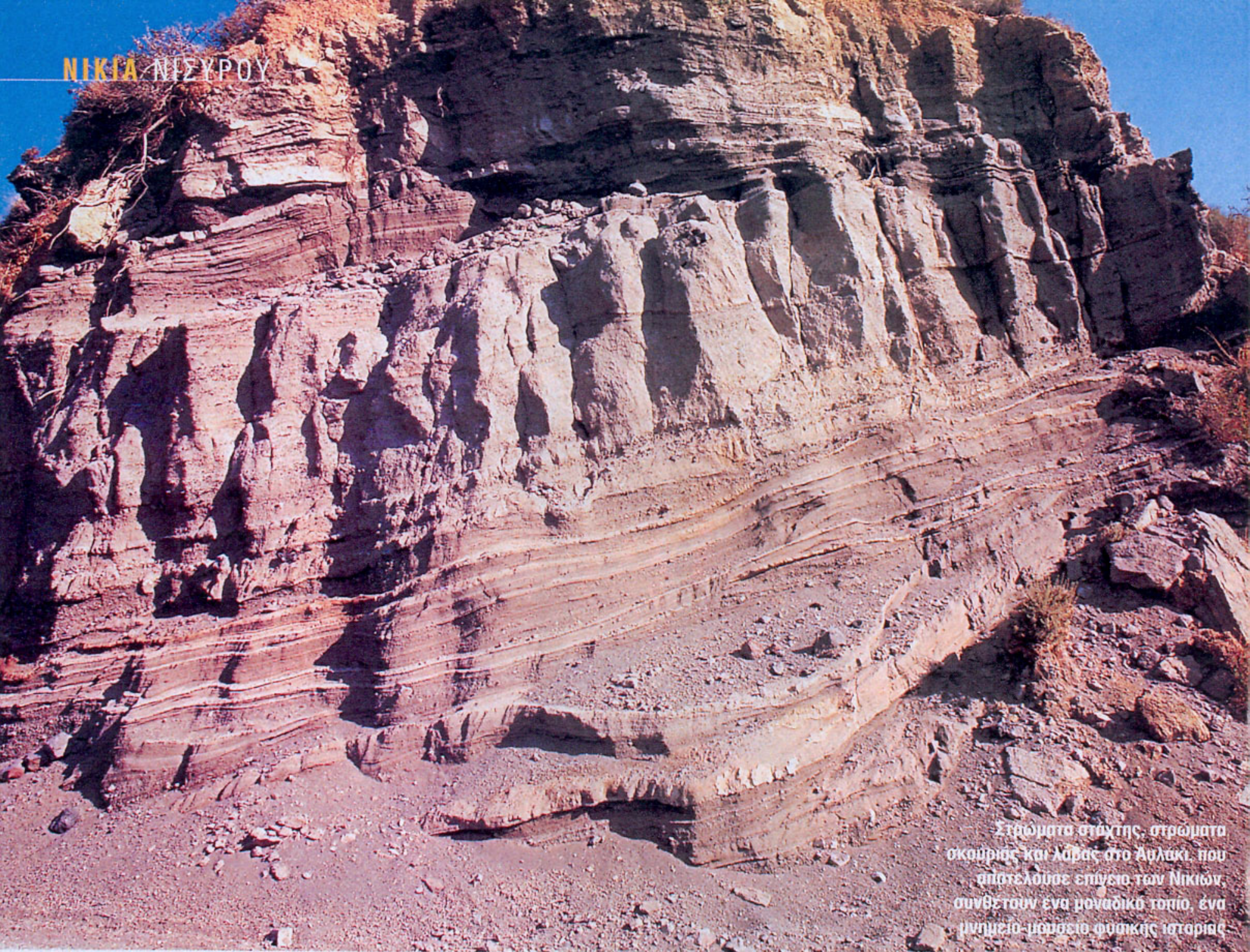
Στρώματα σάχτης, στρώματα σκαύρης και λάβας στο Αηλακι, που αποτέλεσαν επίγειο των Νηκιών, συνθέτουν ένα μοναδικό τοπίο, ένα μνημείο-μωσαϊκό φυσικής ιστορίας

Ε νας οικισμός με μερικές δεκάδες σπίτια στην άκρη της καλντέρας - ενός ηφαιστείου που επιμένει να στέκει όρθιο, παρά τις αλλεπάλληλες καταστροφές που έχει υποστεί και τις φορές που έχει εγκαταλειφθεί από τους κατοίκους του, ύστερα από τις εκρήξεις του Πολυβότη-του μυθικού γίγαντα που θάφτηκε εκεί καταδιωγμένος από το θεό Ποσειδώνα, ο οποίος έριξε πάνω του ένα τεράστιο κομμάτι γης από τη νήσο Κω.