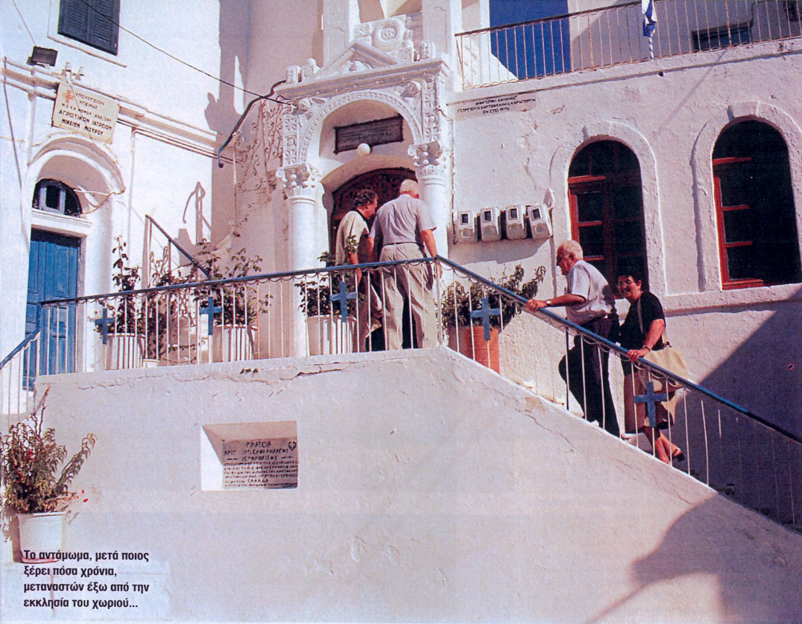
Το αντάμωμα, μετά ποιος ξέρει πόσα χρόνια, μεταναστών έξω από την εκκλησία του χωριού...