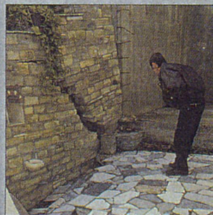
ΑΠΕΛΠΙΣΙΑ ΚΑΙ ΔΕΟΣ. Το σπίτι έμεινε στον αέρα. Το έδαφος γύρω του «φεύγει» προς το ποτάμι.