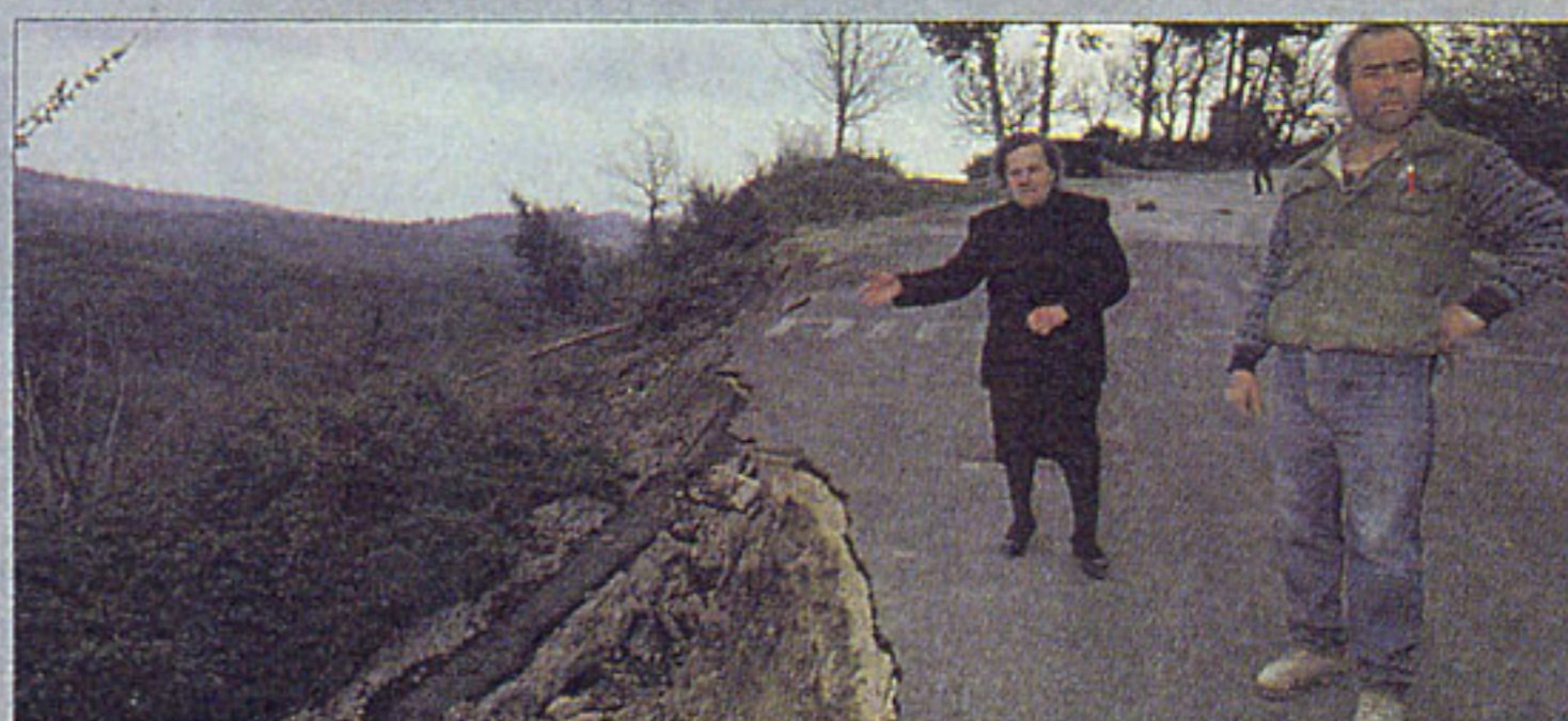
ΚΑΤΟΙΚΟΙ ΤΟΥ ΟΙΚΙΣΜΟΥ ΔΕΝΔΡΑ δείχνουν το χωράφι που υποχώρησε δέκα μέτρα, το δρόμο που βούλιαξε (πάνω) και τον δρόμο που κατέρρευσε (αριστερά).

Θεωρείται πολύ πιθανό πάντως, ότι στην εκτεταμένη κατολίθηση παίζουν ρόλο και κάποια παλιά λιγνιτωρυχεία, η σαθρότητα του εδάφους, αλλά και οι ανθρώπινες επεμβάσεις στο πρηνές.