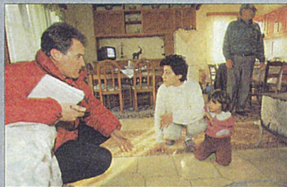
ΒΙΒΛΙΚΗ ΚΑΤΑΣΤΡΟΦΗ στα Βιτάλα. Οι τοίχοι των σπιτιών γεμάτοι ρωγμές, τα πατώματα σχισμένα στη μέση, ενώ η πλαγιά καταρρακιάζει σε μήκος τεσσάρων χιλιομέτρων.