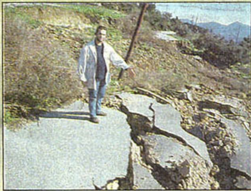
Ο συντάκτης του «Εθνους της Κυριακής» μπροστά στον κεντρικό δρόμο όπου οδηγεί στο χωριό Φρίξα, που έχει καταστραφεί σε μήκος 20 μέτρων.