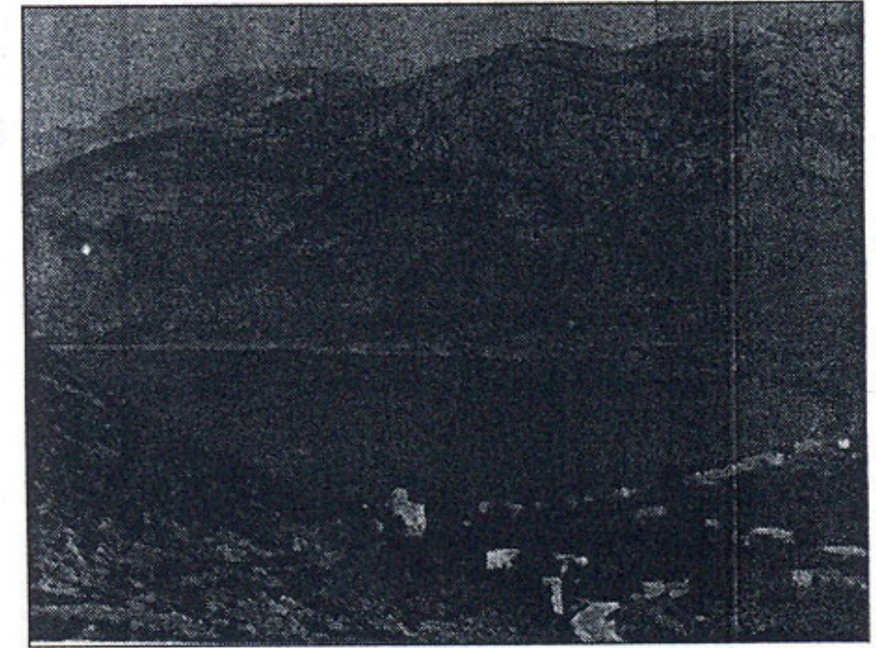
Η Τήλος θα έχει επάρκεια νερού αν τηρηθούν οι βασικές αρχές, την επόμενη δεκαετία

χείριση των υδροφόρων οριζόντων και κατ' επέκτα-