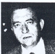
Ο ΣΕΙΣΜΟΛΟΓΟΣ Ευθύμιος Λέκκας.

Ένα άλλο νέο στοιχείο όμως, που φαίνεται να προβληματίζει έντονα τους επιστήμονες, είναι η