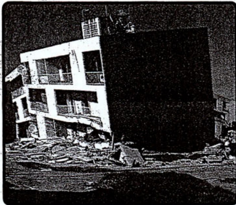
Κείμενο και φωτο: ΕΥΘΥΜΙΟΣ ΛΕΚΚΑΣ

Ωρα 8 το βράδυ της Παρασκευής το αεροπλάνο με το βαρύ φορτίο άρχισε σιγά-σιγά να αφήνει το έδαφος του Θριάσιου πεδίου με ένα εκκωφαντικό θόρυβο. Μια ακόμα αποστολή άρχισε - δεν θυμάμαι ακριβώς ποια - και το μυαλό μου δεν ήθελε καν να μπει στην διαδικασία αναλογισμού των προβλημάτων που έπρεπε να λυθούν και την εξουθένωση, σωματική και ψυχική, που θα ερχόταν τις επόμενες ημέρες. Η μόνη σκέψη που κυριαρχούσε ήταν να προλάβουμε να μην είναι πολύ αργά. Γύρω οι άντρες της ΕΜΑΚ αμήχανοι και ανήσυχοι ρουφούσαν τις τελευταίες στιγμές ξεκούρασης λίγο πριν ριχτούν στην περιπέτεια. Ανοιξα τα ντουλάπια με τα επιστημονικά σκευα, πολλά από τα οποία προέρχονται από ένα meeting της UNESCO που έγινε δεκατρία χρόνια πριν στο Αλγέρι, προπα-