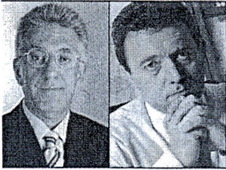
Ο κ. Κακλαμάνης