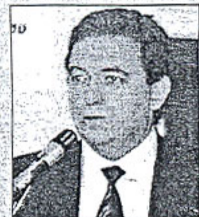
Από τον Ευθ. Λέκκα Καθηγητή Παν/μίου Αθηνών

Όλα επόμενα ενός αγώνα που χάθηκε, μιας αναπόφευκτης ήττας. Εκείνο όμως που έκανε πιο πολύ εντύπωση ήταν οι φυσιογνωμίες, τα πρόσωπα. Άλλα - δυστυχώς λίγα - χωρίς έπαρση, σοβαρά, ολιγομίλητα, με βλέμμα καθαρό, αποφασισμένα για τον αγώνα. Έδιναν την εντύπωση ανθρώπων που είχαν αντιληφθεί τα σφάλματα, τις απαιτήσεις των καιρών, τις υποχρεώσεις απέναντι στο κίνημα, στον κόσμο του ΠΑΣΟΚ. Άλλα - δυστυχώς τα περισσότερα - γνωστά από το παρελθόν, Υπουργοί, Γενικοί Γραμματείς, Πρόεδροι Οργανισμών, Στελέχη, κυρίες και κύριοι του θεάματος και των media, εμπλεκόμενοι σε κάθε είδους διαπλοκή και σκάνδαλα. Φυσιογνωμίες με την έπαρση, με την αλαζονεία ακόμα βαθιά ριζωμένη μέσα τους, με την ψευδαίσθηση ότι ακόμα κρατούν γερά την εξουσία και τα προνόμιά της, με εμφανή υπεροψία. Θλιβερά απομεινάρια μιας άλλης εποχής, τόσο πρόσφατης όμως. Αναρωτιέμαι αν το νέο ΠΑΣΟΚ μπορεί να στηριχθεί στην ίδια μάζα, στα ίδια πρόσωπα. Είναι πεποίθησή μου ότι αν δεν απομακρυνθούν, αν οι ίδιοι δεν κατανοήσουν τη θέση τους μέσα στο κόμμα, μέσα στην κοινωνία, δεν υπάρχει κανένα περιθώριο αλλαγής, κανένα περιθώριο ανάκαμψης, κανένα περιθώριο ανάνεωσης, κανένα περιθώριο δημιουργίας ενός νέου κινήματος, ενός νέου ΠΑΣΟΚ.