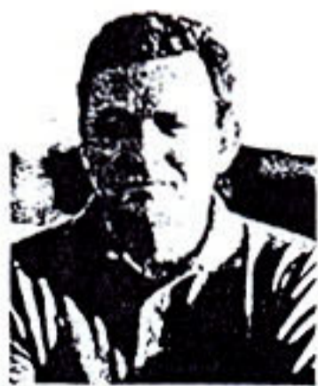
Του Ε. Λέκκα

Η Ακαδημία Εργασίας θα παρέχει γενική εκπαίδευση σε εργαζόμενους σε θέματα ποικίλης μορφής, που θα τους βοηθούν στην περαιτέρω εργασιακή εξέλιξη. Επίσης, θα παρέχει επαγγελματική εκπαίδευση σε νέους, εργαζόμενους και άνεργους, προκειμένου να ενισχύουν τα προσόντα τους ή και να μετεκπαιδεύονται σε νέα αντικείμενα. Επιθυμία της Γ.Σ.Ε.Ε. είναι άλλωστε, όπως έχουν δηλώσει ανοικτά στο παρελθόν οι εκπρόσωποί της, να προχωρήσει και σε μεταπτυχιακές σπουδές. Ανεξάρτητα απ' όλα αυτά, ο όρος Ακαδημία φοριέται πολύ χωρίς όμως να αντιλαμβάνονται αυτοί που τον χρησιμοποιούν τι ακριβώς αντιπροσωπεύει. Μια το πιο λυπηρό, είναι όταν η λέξη προφέρεται από νεανικά χείλη σε διαγωνισμούς κάθε είδους, ικετεύοντας να αποκτήσουν κάποια υπόσπαση τα απαιτητά τους όνειρα.