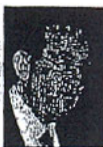
Άρθρο του Ι.Κ. Καράκωστα Καθηγητή και Προέδρου του Τμήματος Νομικής του Πανεπιστημίου Αθηνών

Το άσυλο, που ταυτίζεται με την ελευθερία διακίνησης ιδεών, γνώσης και διδασκαλίας δεν σημαίνει ασυδοσία και διάπραξη κολασμών πράξεων στο χώρο του Πανεπιστημίου.