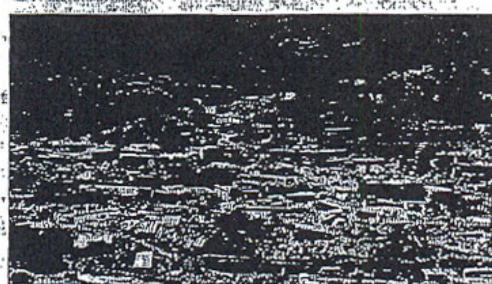
Ο σεισμός της 8ης Οκτωβρίου στο βόρειο τμήμα του Πακιστάν με μέγεθος 7,6 R είχε τεράστιες επιπτώσεις σε μια εκτεταμένη και πολύπαθη περιοχή

Τέταρτη ιδιομορφία είναι οι προοπτικές για τους κατοίκους του Πακιστανικού Κασμίρ. Είναι δυσσώωνες περισσότερο από κάθε άλλη περίπτωση φυσικής καταστροφής. Το