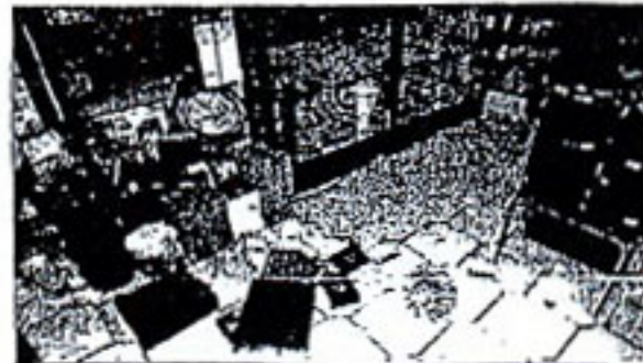
Το υποθαλάσσιο επίκεντρο απέτρεψε μεγαλύτερες ζημιές, λένε οι σεισμολόγοι

Τα κλιμάκια του Οργανισμού Αντισεισμικού Σχεδιασμού και Προστασίας που κατέβησαν στην περιοχή είχαν καταγράψει μέχρι χθες το μεσημέρι ζημιές σε περίπου 60 κτίρια, με σοβαρότερες εκείνες που υπέστη η Βιβλιοθήκη της Ζακύνθου. Ρωγμές εντοπίστηκαν, επίσης, στο λιμάνι και σε δύο γέφυρες του νησιού, χωρίς όμως να αξιολογούνται ως σοβαρές. «Μέχρι στιγμής τα προβλήματα δεν είναι μεγάλης έκτασης, κατολισθήσεις δεν υπήρξαν, ενώ εξακολουθούμε να βρι-