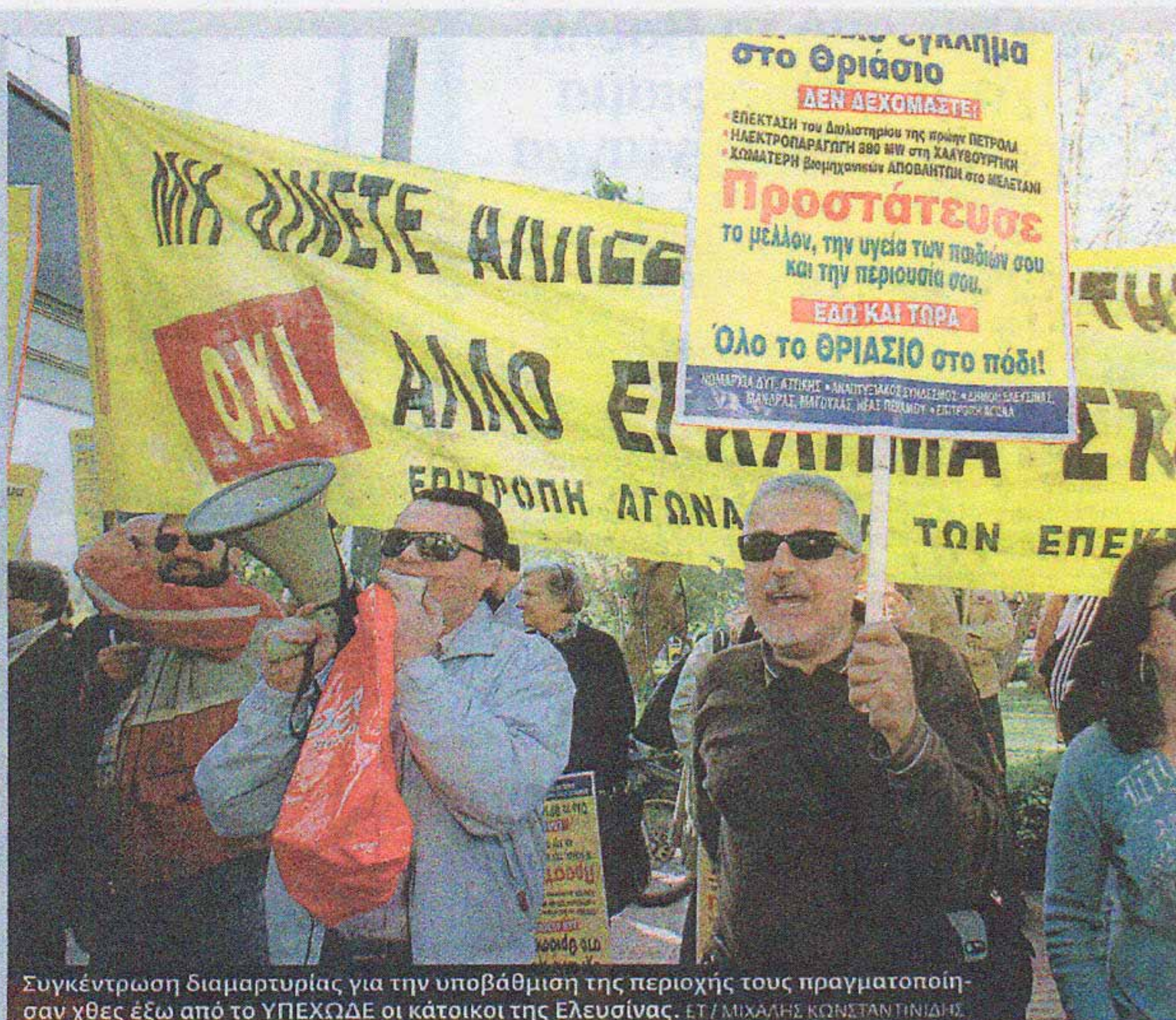
Συγκέντρωση διαμαρτυρίας για την υποβάθμιση της περιοχής τους πραγματοποιήσαν χθες έξω από το ΥΠΕΧΩΔΕ οι κάτοικοι της Ελευσίνας.

Παρά τις καταδίκες όμως, οι τόνοι των αποβλήτων που παράγονται καθημερινά από τις δεκάδες βιομηχανίες της περιοχής εξακολουθούν να αποθηκεύονται μέσα στις εγκαταστάσεις παραγωγής ή να απορρίπτονται, παρανόμως, αλλού, όπως καταγγέλλουν οι κάτοικοι. Ως λύση έχει προταθεί, ήδη από το 2006, η «χωματερή»