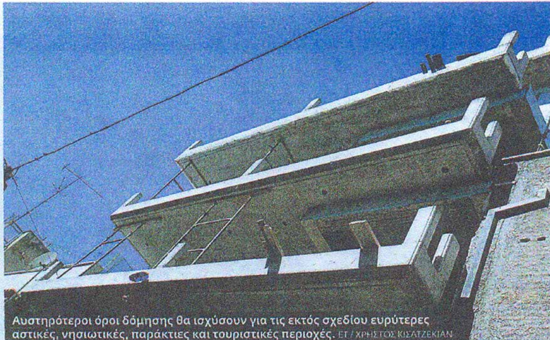
Αυστηρότεροι όροι δόμησης θα ισχύσουν για τις εκτός σχεδίου ευρύτερες αστικές, νησιωτικές, παράκτιες και τουριστικές περιοχές. ΕΤ / ΧΡΗΣΤΟΣ ΚΙΣΑΤΖΕΚΙΑΝ