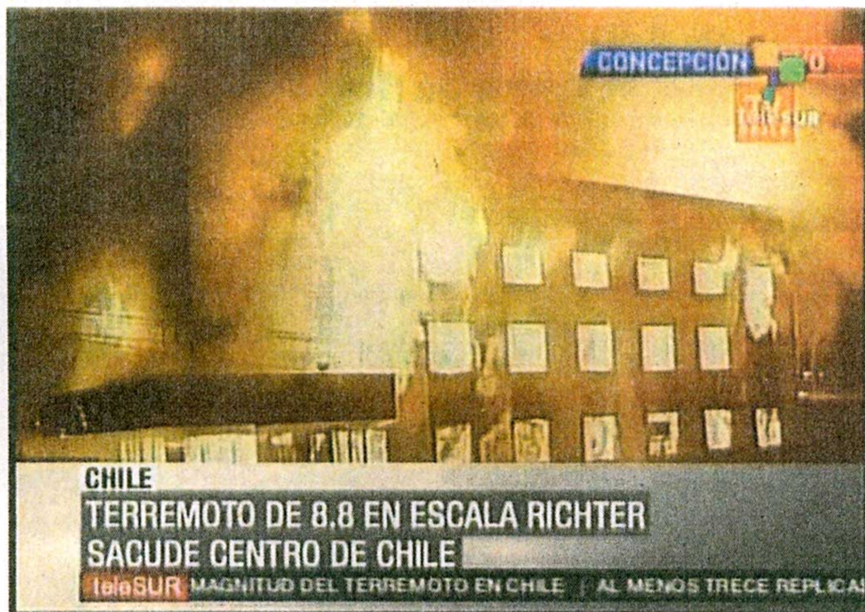
Οι πρώτες εικόνες της χιλιανής τηλεόρασης από την πόλη Κονσεπσιόν, τη δεύτερη μεγαλύτερη της χώρας, έδειχναν μεγάλο κτίριο να φλέγεται λίγη ώρα μετά τον καταστροφικό σεισμό των 8,8 Ρίχτερ, με επίκεντρο 100 χλμ. από την πόλη.

«Πρόκειται για έναν από τους πέντε μεγαλύτερους σεισμούς παγκοσμίως τα τελευταία εκατό χρόνια», δήλωσε στην «Κ» ο καθηγητής Γεωλογίας στο Πανεπιστήμιο Αθηνών, κ. Ευθ. Λέκκας. Σύμφωνα με τον ίδιο, η ισχυρότατη σεισμική δόνηση, η οποία σε καμία περίπτωση δεν επηρεάζει την Ελλάδα ούτε και την υπόλοιπη Ευρώπη, έγινε σε κομβικό σημείο, όπου συγκρούονται οι πλάκες του Ειρηνικού με την πλάκα της Νοτ. Αμερικής. Από τον χθεσινό σεισμό με βάθος 35 χλμ., το ρήγμα δεν έφτασε με το μέγιστο «άλμα» του στον πυθμένα της θάλασσας. Κατά συνέπεια το τσουνάμι, εκτιμούσαν οι επιστήμονες, δεν θα υπερέβαινε τα 2 - 3 μέτρα. Επειδή η κλίση του ρήγματος είναι προς τα δυτικά, η ενέργεια του σεισμού διοχετεύθηκε κυρίως προς τον θαλάσσιο χώρο και για τον λόγο αυτό οι καταστροφές θα είναι πιθανότατα αρκετά πιο περιορισμένες από αυτές στην Αϊτή. Από την πρώτη στιγμή που έγινε γνωστό το χτύπημα του Εγκέλαδου στη Χιλή, το ελληνικό υπουργείο Εξωτερικών ενεργούσε τη Μονάδα Διαχείρισης Κρίσεων για όσους θέλουν να αναζητήσουν δικούς τους ανθρώπους στη Χιλή. Μέχρι χθες αργά το απόγευμα, δεν υπήρχε κάποια πληροφορία ότι μεταξύ των θυμάτων υπάρχουν Έλληνες. Οι ενδιαφερόμενοι, πάντως, μπορούν να επικοινωνούν με το 210-36.81.912.