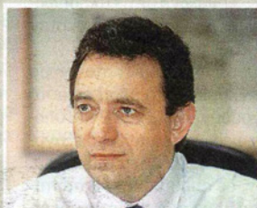
ΕΥ. ΛΕΚΚΑΣ: Έχουμε δεκάδες μετασεισμούς με μέγεθος από 2,5 έως 4 βαθμούς της κλίμακας Ρίχτερ, που δείχνουν ότι τα πράγματα βαίνουν προς εκτόνωση