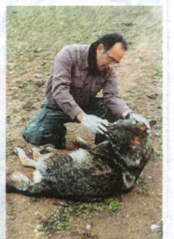
▲ Ο ΛΥΚΟΣ ήταν αρσενικός, ηλικίας 7 ετών και βάρους 65 κιλών

βια Τρικάλων, θύματα κτηνώδεις έπεσαν τα τέσσερα από τα πέντε αδέσποτα που φρόντιζε και τάιζε καθημερινά μια οικογένεια έξω από το σπίτι της. Αυτόπτης μάρτυρας κατήγγειλε ότι είδε ένα αυτοκίνητο να σταματά στην περιοχή και τον οδηγό του να αφήνει 4 πλαστικά δοχεία με γάλα και δηλητήριο. Στον πάτο τους είχεβάλει πέτρες για να μην τα πάρει αέρας. Η οικογένεια προχώρησε σε καταγγελία, ενώ οι φιλοζωικές οργανώσεις καλούν όποιον γνωρίζει το όνομα του δράστη να το αναφέρει.