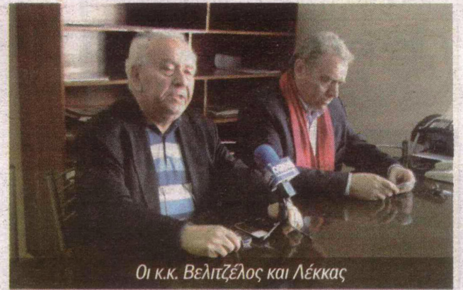
Οι κ.κ. Βελιτζέλος και Λέκκας

"Έχουμε κάνει αυτοψία στην περιοχή. Μερίμνησαν για αυτό οι τεχνικές υπηρεσίες. Υπάρχει πρόβλημα που θα πρέπει να αντιμετωπιστεί το συντομότερο δυνατό. Έχει εντοπιστεί ένα ρήγμα αλλά δεν χρήζει