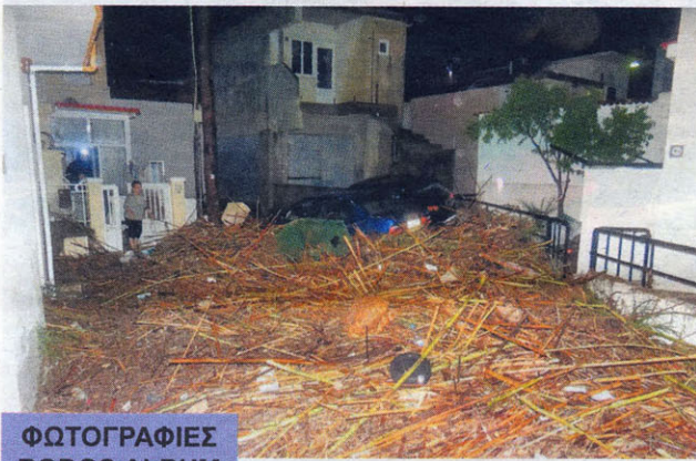
ΦΩΤΟΓΡΑΦΙΕΣ RODOS ALBUM